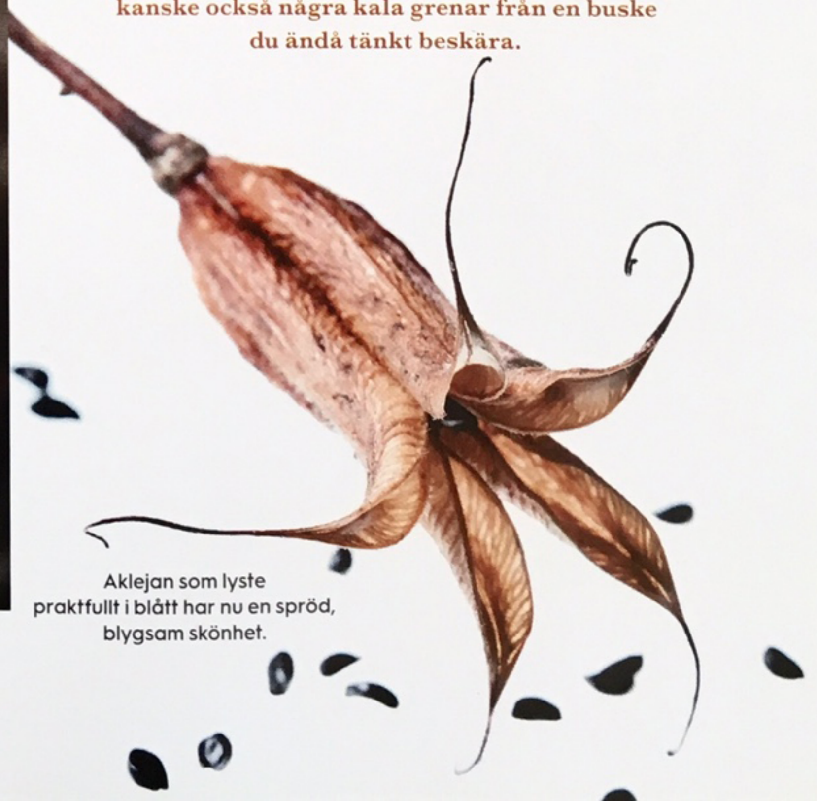
Aklejan som lyste praktfullt i blått har nu en spröd, blygsam skönhet.

Gör rent dina trädgårdsverktyg, se över om något måste lagas. Gör en bukett av vissnade och torra blommor – den kan bli fantastiskt vacker. Blanda i något grönt i buketten, till exempel en reva från murgrönan, kanske också några kala grenar från en buske du ändå tänkt beskära.