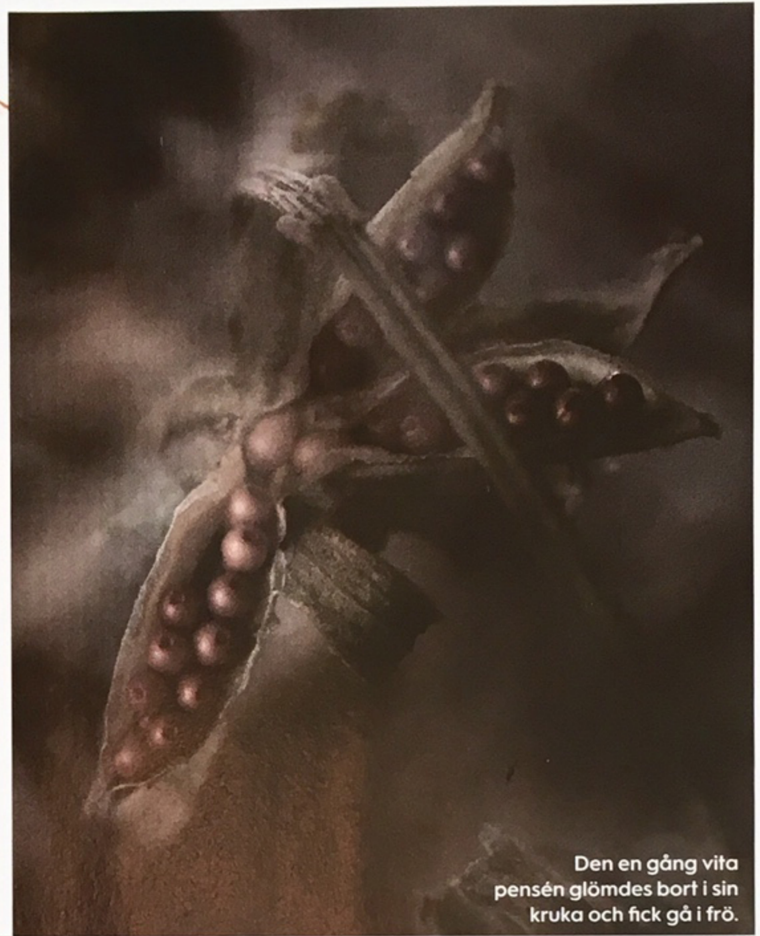
Den en gång vita pensén glömdes bort i sin kruka och fick gå i frö.