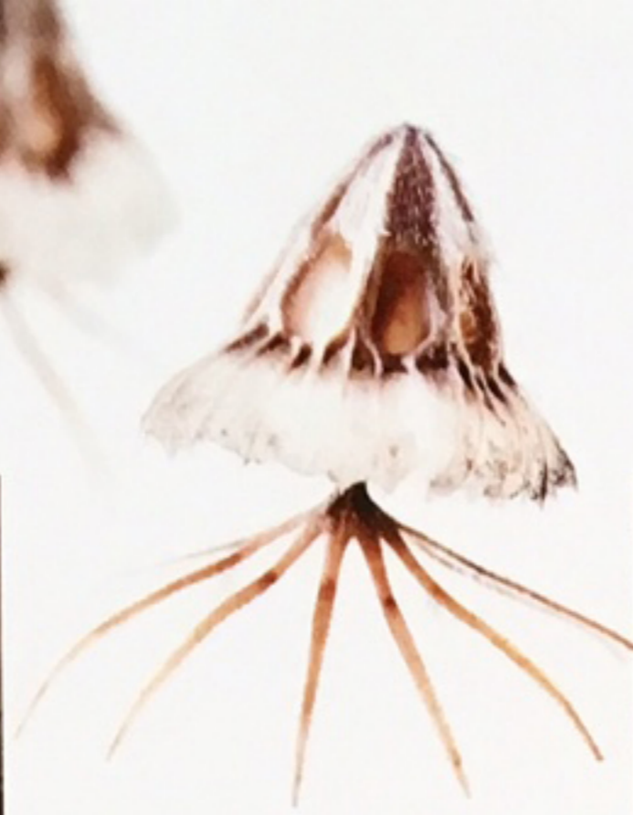
Praktväddens vita frön liknar pyttesmå rymdfarkoster.