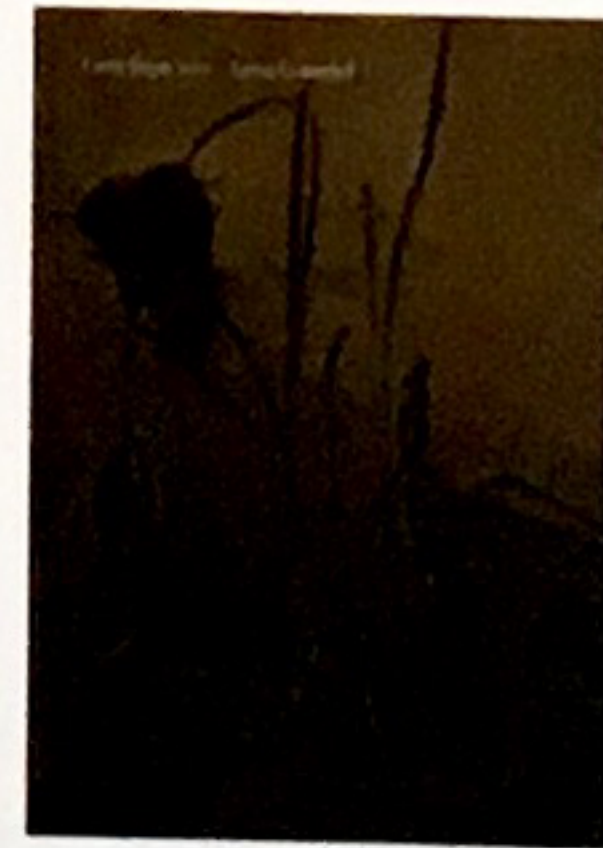
FLORA SUPERSUM AV Lena Granefelt /BOKFÖRLAGET ARENA